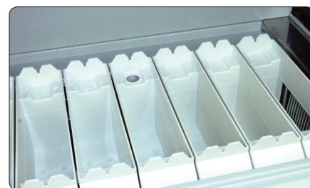
До 18 доступных емкостей для реагентов