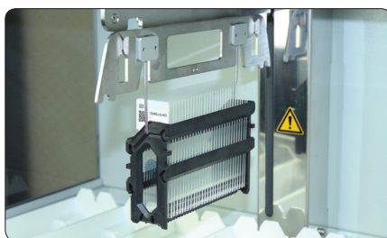
Загрузка до 30 слайдов в штатив